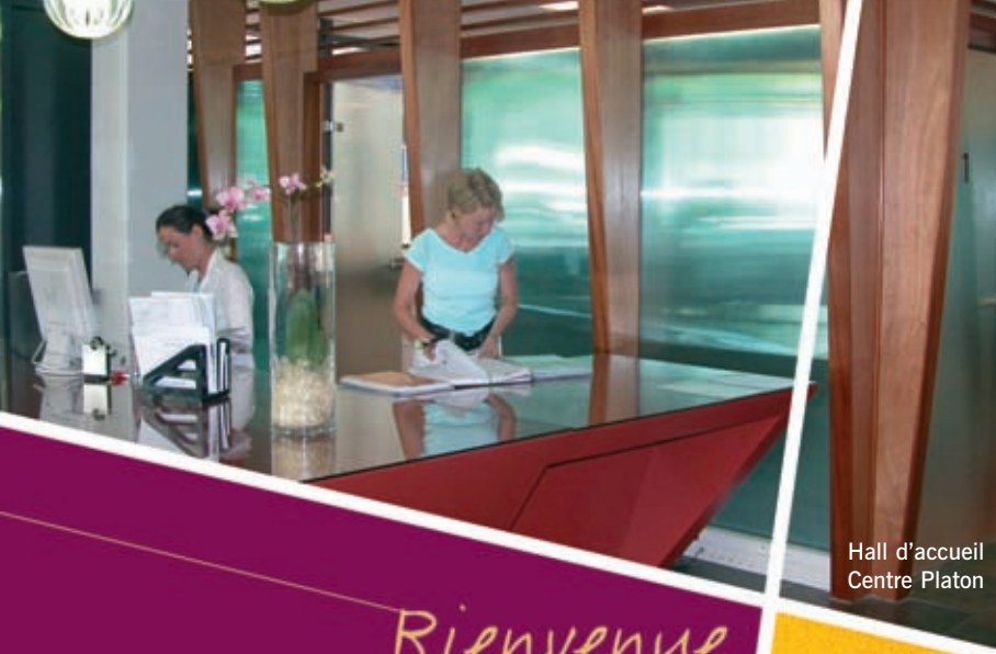
Hall d'accueil Centre Platon